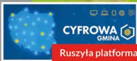
Ruszyła platforma Cyfrowa gmina Skaryszew