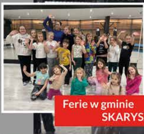
Ferie w gminie SKARYSZEW