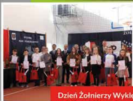
Dzień Żołnierzy Wyklętych w PSP w Dzierzkówku Starym