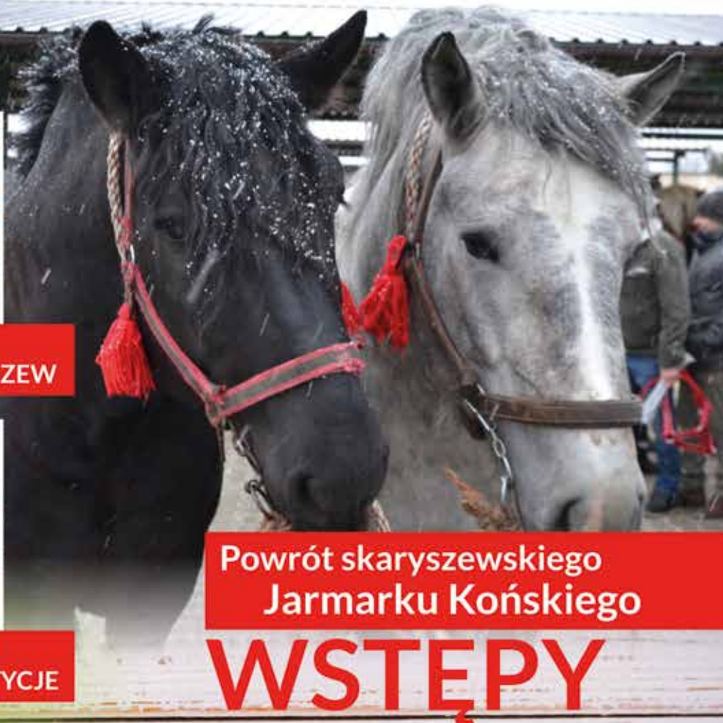
Powrót skaryszewskiego Jarmarku Końskiego