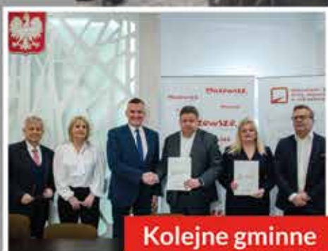
Kolejne gminne INWESTYCJE