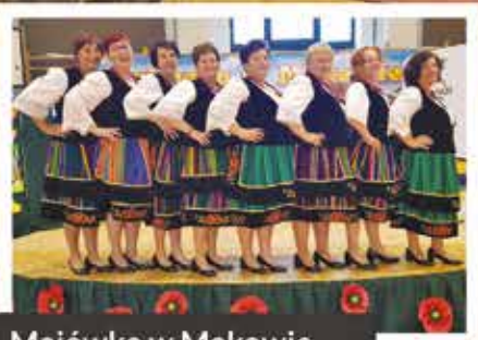
Majówka w Makowie