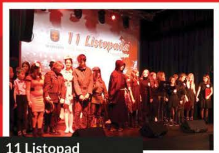
11 Listopad w MGOK Skaryszew