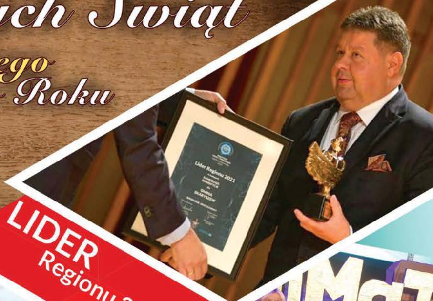
LIDER Regionu 2021