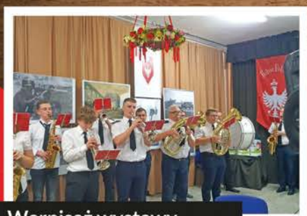
Wernisaż wystawy na Targowej

Życzymy Wam Wesołych Świąt oraz Szczęśliwego Nowego Roku