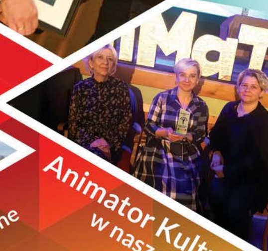
Animator Kultury w naszej gminie