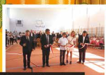
Otwarcie sali gimnastycznej w Dzierzkówku Starym