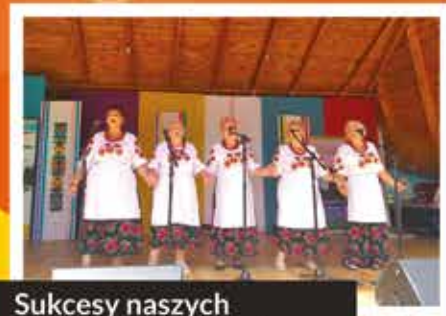
Sukcesy naszych Chomentowianek!